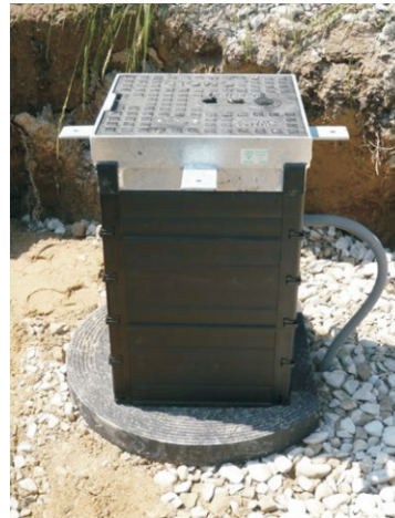
...aufstellen und vergraben des „mini“ Schachtes...