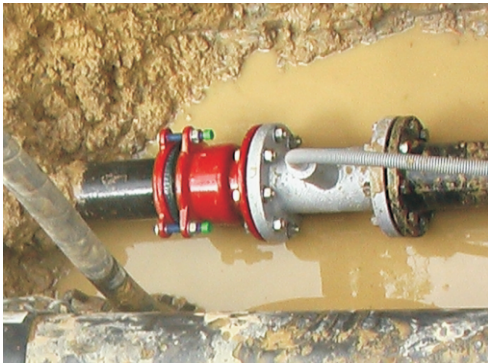
...einflanschen und vergraben des Messaufnehmers...