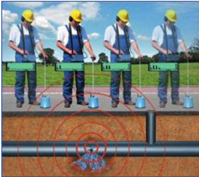
Aufbau einer Messung